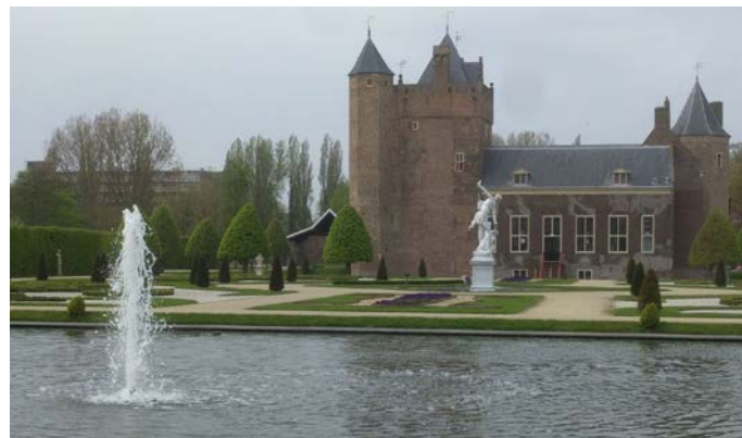
Slot Assumburg te Heemskerk, met tuin en vijver