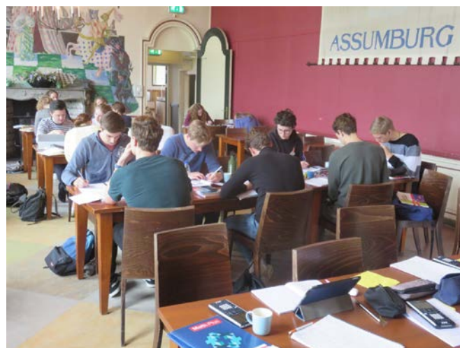
Leerlingen geconcentreerd aan het werk met examenvraagstukken

Elk schooljaar, als de schoolexamens voltooid zijn, organiseren de secties natuurkunde en wiskunde voor de examenkandidaten havo en vwo het 'Sommenkamp'. Als voorbereiding op het landelijke centrale examen oefenen de leerlingen twee dagen intensief met eerdere examens. Doel van deze examentraining is om een zo realistisch mogelijk beeld te verwerven van de vereisten voor het succesvol afsluiten van dit laatste examen. En om onder begeleiding van eerstegraads docenten eventuele lacunes in kennis of vaardigheden te verhelpen. De gekozen locatie is bijzonder en draagt bij aan een ontspannen sfeer en het gevoel er even helemaal uit te zijn, maar wel met een doel. De locatie, het slot Assumburg, is een kasteel in het oosten van Heemskerk en dateert uit de 13e eeuw. De prachtige tuin biedt gelegenheid om tussentijds even de benen te strekken en een frisse neus te halen.