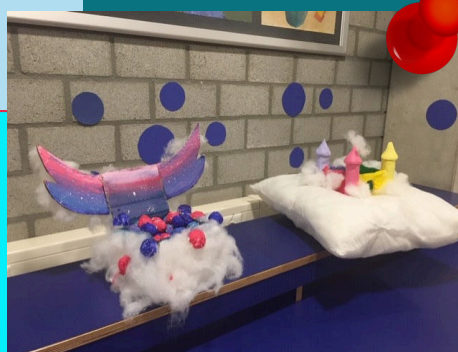
Art & Design H2 & H3 Dromen Expositie

Daarna kreeg je steeds één beroep en moest je kiezen of je het leuk of niet leuk vond. Toen moesten we uit twee beroepen kiezen welke je het leukst vond en van dat leukste beroep moest je kiezen of je het leuk of tamelijk leuk vond. Als je alles had ingevuld kreeg je te zien welk profiel het beste bij je past. Voornamelijk waren dat twee profielen. Kiki: 'ik had als uitkomst e&m en c&m en dat was ook wat ik had verwacht.'